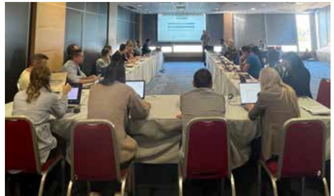
Projekttreffen der Projektpartner aus 8 Ländern in Feldbach

Auch 2025 wird intensiv an diesem internationalen INTERREG-Programm gearbeitet, das Kooperationen mit Partnern aus acht Nationen umfasst. Das Hauptziel ist die stärkere Inwertsetzung regionaler kulinarischer und handwerklicher Produkte entlang touristischer Radwege. Die Weiterentwicklung der Angebote entlang der grenzüberschreitenden Radrouten soll nicht nur den Tourismus, sondern auch lokale Produzent:innen nachhaltig stärken und die Region als Vorreiter im Bereich inklusives und genussorientiertes Radfahren etablieren.