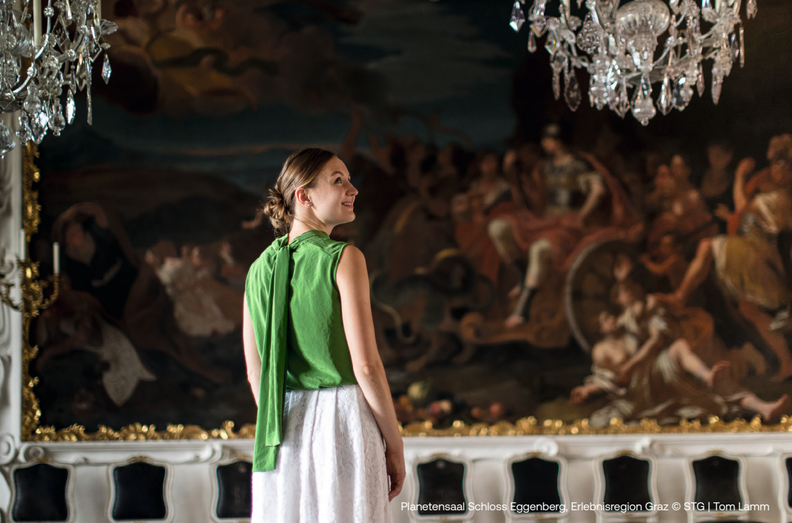
Planetensaal Schloss Eggenberg, Erlebnisregion Graz